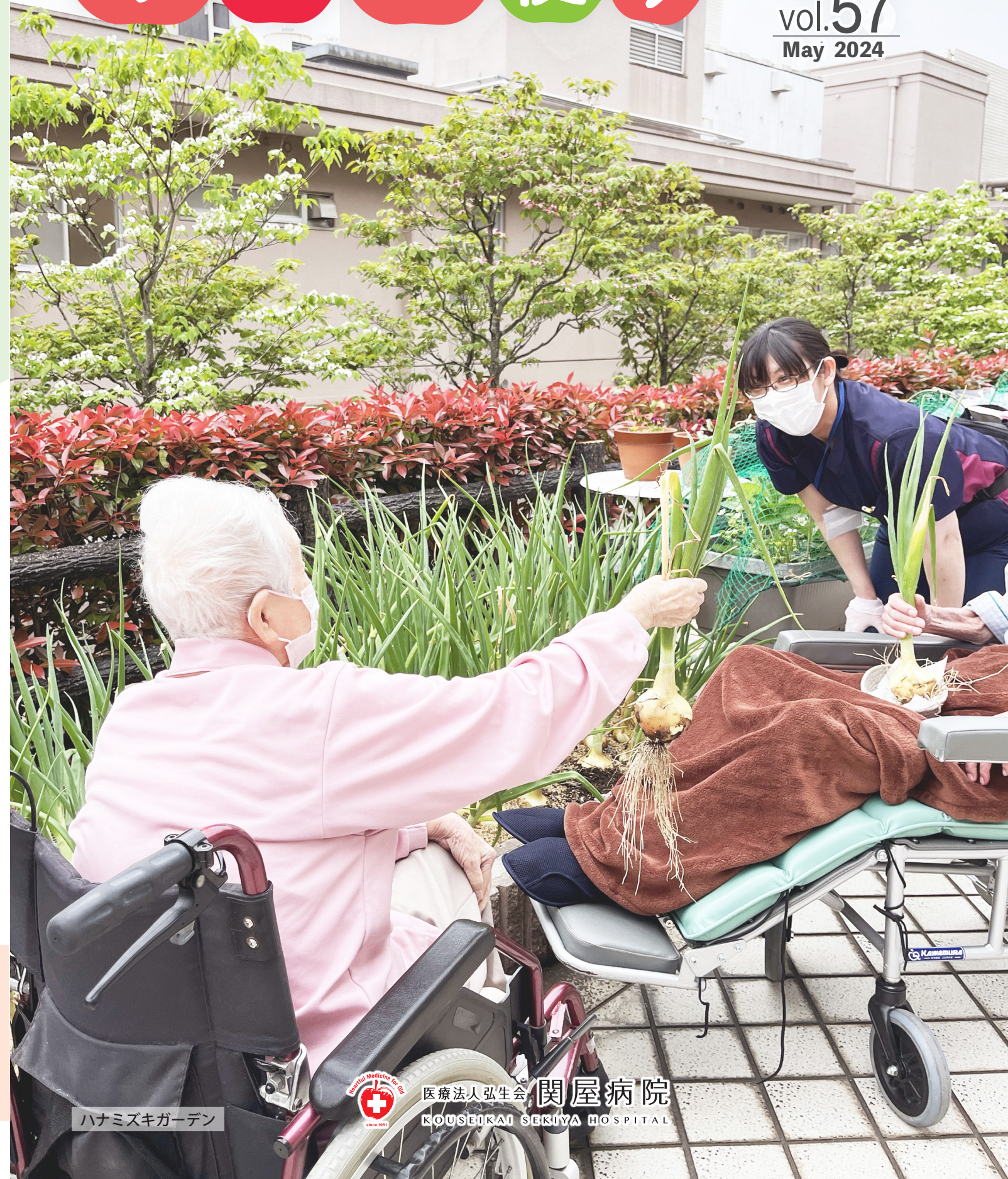
ハナミズキガーデン