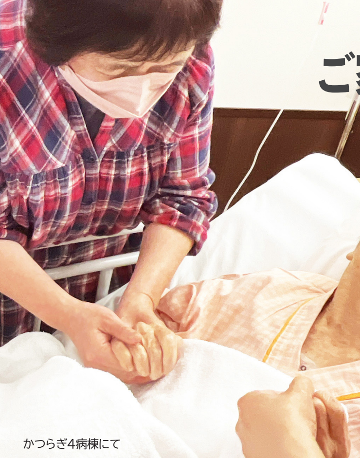
かつらぎ4病棟にて