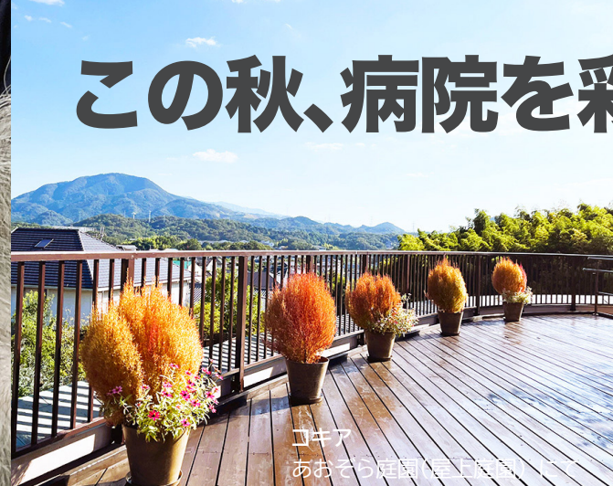
コキア あおぞら庭園(屋上庭園)

赤く色づいたコキアを乾燥させ、葉を束ねて、カットして、種を落として・・・ いろんな工程にたくさんの患者さまとスタッフが関わって、1本のミニほうきを仕 上げました。「ほうき使ってくれるかな」「どんな人が持って帰ってくれるのかな」 とお持ち帰りいただくことを想像していると、自然と会話が弾まれたそうです。 GreenLife care