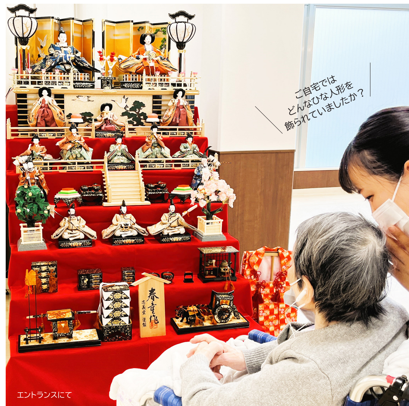
エントランスにて

寒さの中にも少しずつ春の暖かい日差しが感じられるこの頃、皆さまいかがお過ごしでしょうか。今月のりんご便りは、コキアで作ったミニほうきの贈り物やお誕生日メール、その他の行事などについてご紹介しております。ご高覧いただけましたら幸いです。