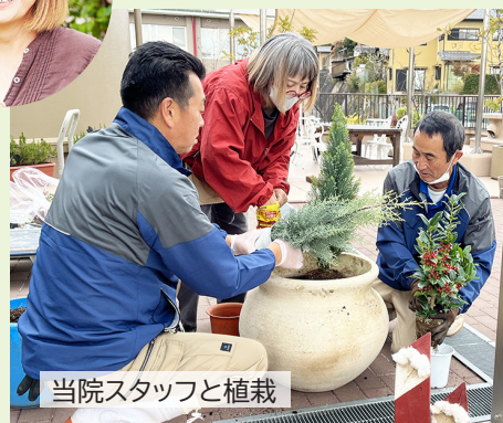
当院スタッフと植栽