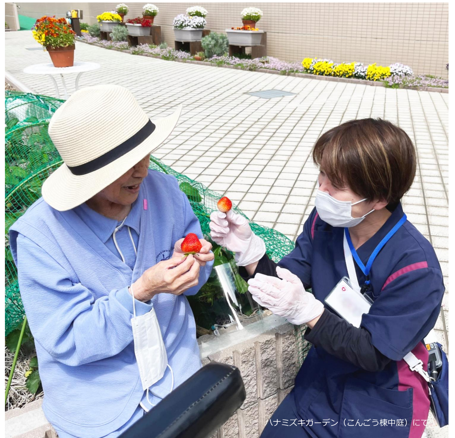
ハナミズキガーデン（こんごう棟中庭）にて