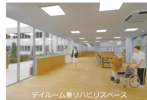
デイルーム兼リハビリスペース

北側と南側をつなぐ場所は「デイルーム兼リ ハビリスペース」になります。右の写真がイ メージ図です。広いスペースでゆったりと、 くつろいでいただける場所になる予定です。